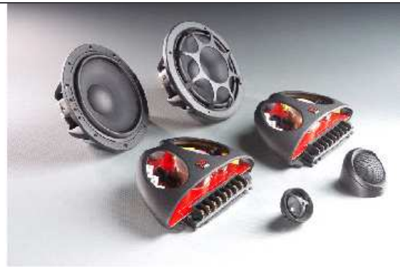
Hybrid Ovation 6 – 2 Way System