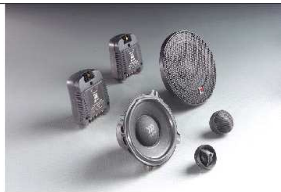
Dotech MK II 5 – 2 Way System