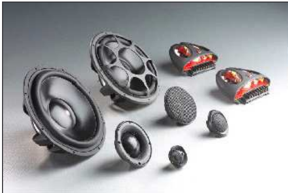
Elate 9 – 3 Way System