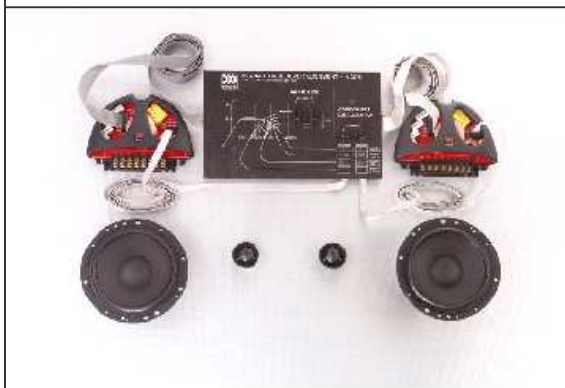
Hybrid Ovation 6 With The Alignment System