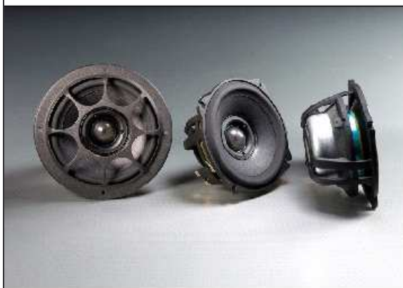
Integra Ovation 5